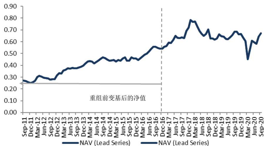
NAV Performance (USD)