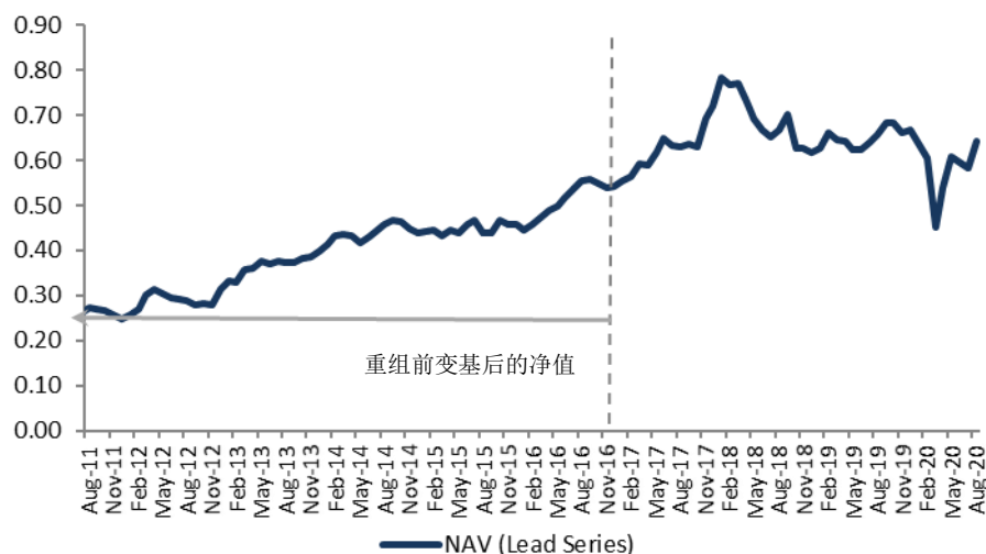
NAV Performance (USD)