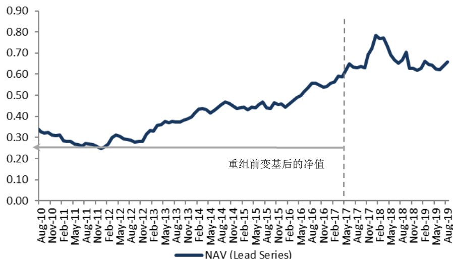
NAV Performance (USD)