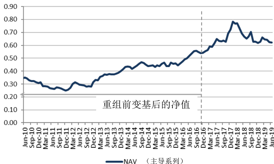
NAV Performance (USD)