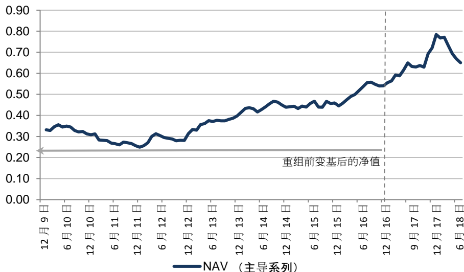
NAV Performance (USD)