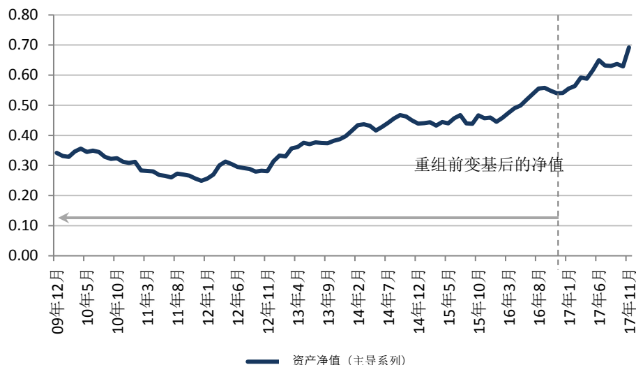
资产净值表现 (美元)