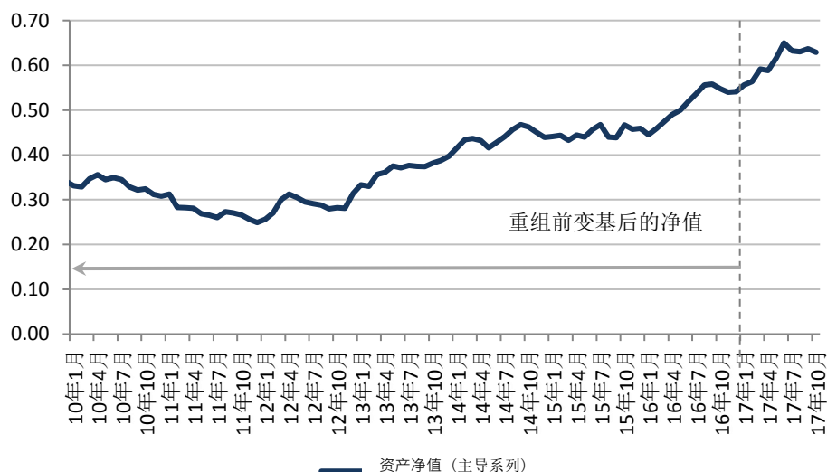
资产净值表现 (美元)