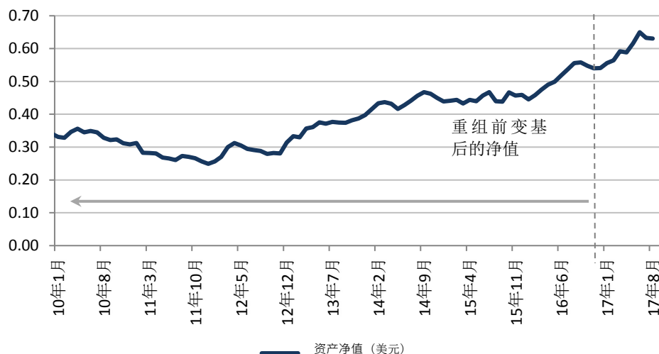
资产净值表现 (美元)